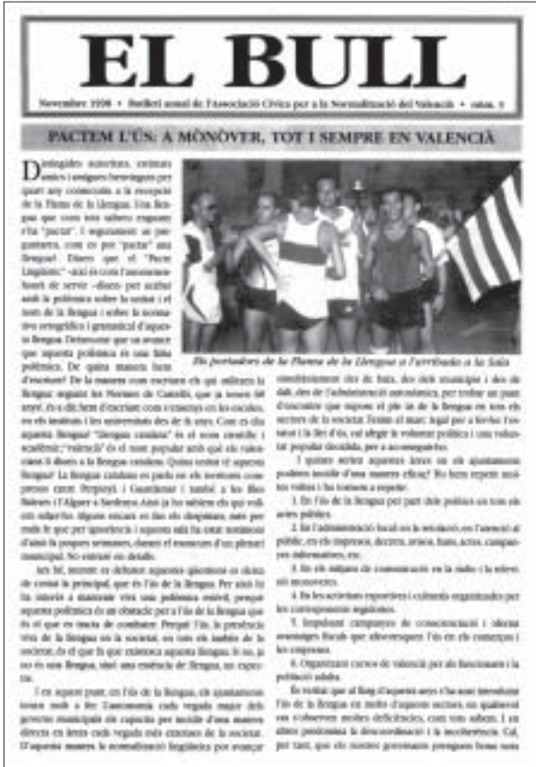
Portada del butlletí núm. 3 de l'Associació El Bull de Monòver

21 d'octubre 1998: El Tempir, com ja és tradicional, posa a la venda participacions de la loteria nadalenca amb el número 46018 (vegeu pàg. 29).