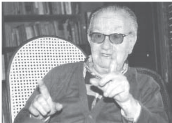
Joan Brossa va ser un dels creadors contemporanis més importants de l'avantguarda