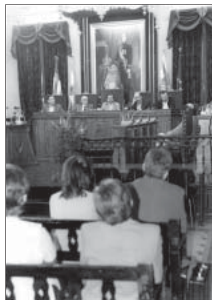
Durant la sessió acadèmica es va llegir diverses ponències a la Sala del Consell d'Elx.