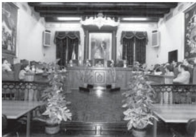
Sessió acadèmica de l'IEC a la Sala del Consell d'Elx.

A mb l'objectiu de conèixer la realitat sociolingüística i cultural de les diverses comarques dels territoris de llengua i cultura catalana, la Secció Filològica de l'Institut d'Estudis Catalans (IEC) va visitar Elx i la Universitat d'Alacant els passats dies 16 i 17 d'octubre amb un atapeït programa d'activitats: visites protocol·làries, sessions acadèmiques, col·loquis amb intercanvi d'opinions i parers entre els integrants de la Secció Filològica i destacades persones del món cultural, social i polític d'Elx i de la comarca de l'Alacantí.