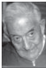
Joan Coromines (1905-1997)